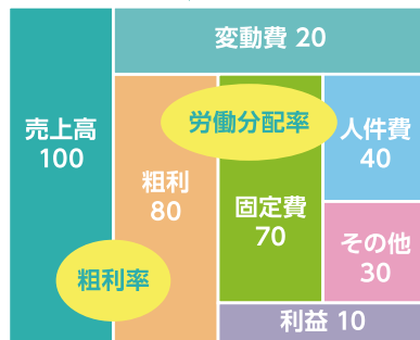
※お金のブロック図